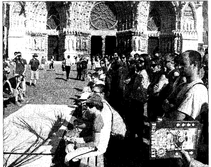
Pas de doute, les artistes apportaient un plus aux badauds du parvis.