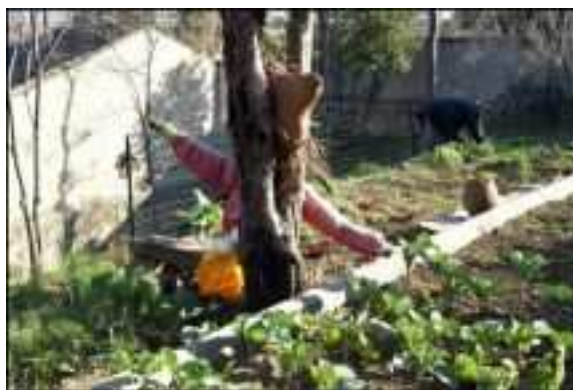
Jardin Potager Gare Franche Marseille

Pour le projet Friche, la complémentarité dans le paysage artistique et culturel rémois est essentiel. Il ne s'agit pas de construire un lieu pour lui-même mais pour ce qu'il produit. La Friche est innovante et importante aujourd'hui à Reims dans sa volonté d'insuffler un état d'esprit dans toute la ville.