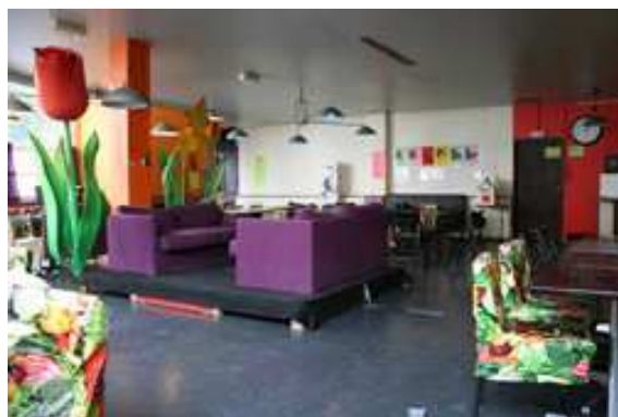
Cafétéria de Mains d'Œuvres

Actuellement : lieu de créativité tout azimut. Présence des différentes disciplines (musique, danse, théâtre, multimédia). Des espaces en location, des associations résidentes de manière plus pérenne, et une équipe qui gère des résidences et une programmation d'événements (direction + comité de programmation + cuisinier). Lieu convivial, ouvert en permanence avec importance de l'espace bar-restauration. Importance des liens avec les populations et de la créativité sociale au-delà des propositions artistiques (AMAP, Produit intérieur doux, accueil de conférences, etc.). Propositions artistiques pointues qui entraînent une reconnaissance au niveau national (par exemple la programmatrice danse fait partie de la commission DRAC Ile-de-France). Importance de la dimension internationale , fait partie des membres fondateurs de Trans Europe Halles.