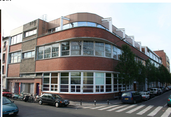
Vue extérieure