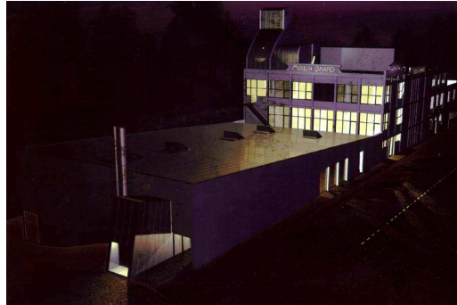
Étude de définition 2000 - Architecte : Yves Le Jeune