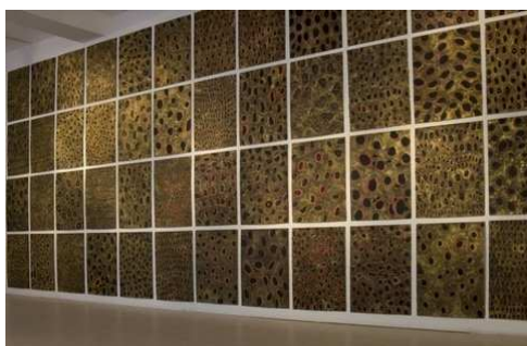
Les Merveilles (Chambre 3)

L'artiste propose cette fois un parcours en cinq chambres, un vaste voyage, aux confins des univers décryptés par elle, livrés aux regards et servis par une technicité longuement élaborée et mise en œuvre d'une manière multiple sur des supports variés. Le rêve est au rendez-vous.