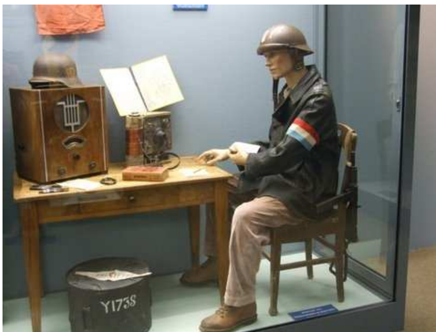
Vue d'une nouvelle vitrine du musée de la Reddition

Samedi 17 mai 2008 de 20h à 24h, entrée gratuite