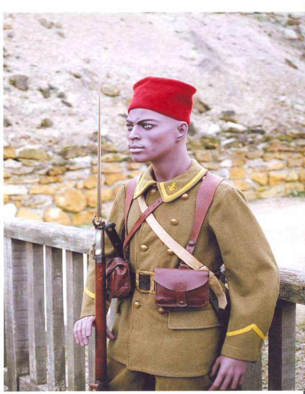
Musée du Fort de la Pompelle - Tirailleur Sénégalais 1915-

Samedi 17 mai 2008, de 11h à 21h, entrée gratuite toute la journée