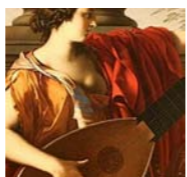
© LAURENCE DE B. HENRI (2008)