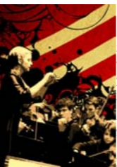
© DES FANTASIES MUSICALES DE THOMAS SAMPAYO

MER 15 FÉV 12 | À PARTIR DE 18 H30 _AUDI 1