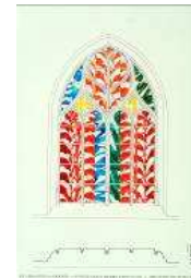
Gérard Titus-Carmel Sans titre , 2002 Dessin préparatoire baie 13. Projet pour l'église Saint-Pierre-et-Saint-Paul de Villenauxe-la-Grande, Aube, 50 x 40 cm DRAC Champagne-Ardenne © ADAGP, Paris 2011