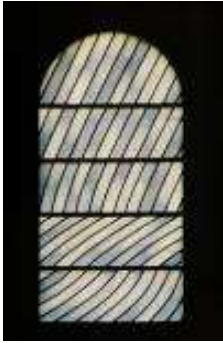
Pierre Soulages Vitrail. Abbaye Sainte-Foy, Conques, Aveyron. Réalisation : Atelier Fleury, Toulouse