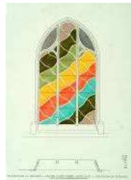
David Tremlett Sans titre , 2002 Dessin préparatoire baie 18 pour l'église Saint-Pierre-et-Saint-Paul de Villenauxe-la-Grande, Aube, 50 x 40 cm DRAC Champagne-Ardenne © David TREMLETT