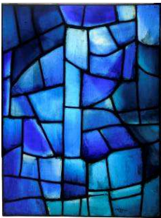
Serge Poliakoff -. Composition , 1963. Vitrail. Réalisation: Atelier Simon Marq, Reims