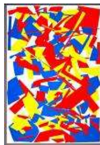
Imi Knoebel Messerschritte, Rot Gelb Blau, 18/54 1978-1979 Collages de papiers et acrylique découpés Cycle de 54 œuvres de 100 x 70 cm chacune Collection de l'artiste © Imi Knoebel