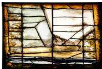
Joseph Sima. Sans titre , 1959-1960