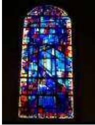
Albert Manessier Paysage bleu , vitrail réalisé pour l'église Saint-Michel des Bréseux, Doubs, 1948-50. Vitrail. 305 x 95 cm – Réalisation : Atelier Lorin, Chartres © ADAGP, Paris 2011 © DRAC Franche-Comté - Photo : Jean Marx