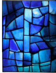
Serge Poliakoff. Composition , 1963 Vitrail. 124.7 x 94.8 cm Inv. FNAC : 1172. Inv. : D.2011.1.4 Dépôt du Centre national des arts plastiques – ministère de la Culture et de la Communication, Reims, musée des Beaux-arts Réalisation : Atelier Simon Marq, Reims © ADAGP, Paris 2011