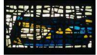
Raoul Ubac Sans titre , 1960 Dalle de verre. 106 x 220 cm Inv. KK 1047 Aix-la-Chapelle, Allemagne, Suermondt Ludwig Museum, Don Ludwig Réalisation : Atelier Oidtmann, Linnich © ADAGP, Paris 2011