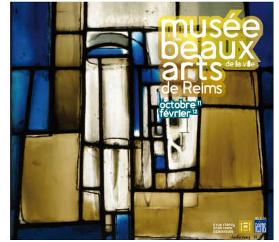
Charles Marq, Intérieur ou Nature Morte (détail), 1963, Vitrail 107,8 x 83,8 cm Inv. FNAC 1174 Inv : D.2011.1.3 Dépôt du Centre national des arts plastiques – ministère de la Culture et de la Communication, Reims, musée des Beaux-arts Réalisation Atelier Simon Marq, © ADAGP, Paris, 2011