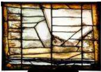
Joseph Sima Sans titre , 1959-1960. Vitrail.