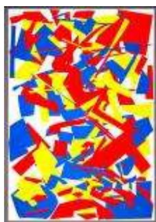
Imi Knoebel Messerschnitte Rot Gelb Blau , 18/54, 1978-1979 Collages de papiers et acrylique découpés

Klaus Wolf Knoebel passe son enfance à Grumbach près de Dresde, et à Mayence. Un événement va marquer cette période : le 13 février 1945, il assiste depuis la fenêtre de son grenier à l'incendie de Dresde.